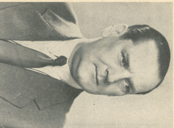
J. van der Heem